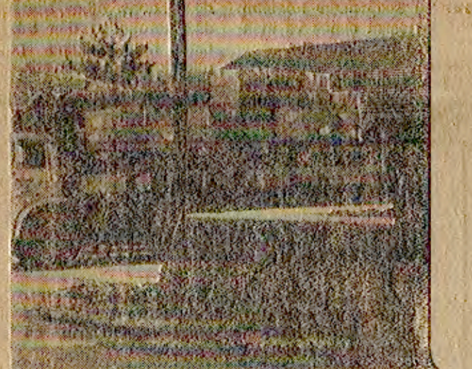
Sirt Bakkallar Derneği Başkanı yad tanzim sayış yapıyor.

Yereliz konu ile ilgili olarak «100 bin metrekarelik alanda 40 bin metrekarelik fidan yetiştirmek için ayırıldı. Geri kalan kesimde ise yaşı gübre dökme ile toprak hazırlanıyor. 12 gram tohumun aldığı metrekarede 250 fidan yetiştiriliyor. İki yıl sonra fidanlar dikim sahasına dikilerek ormanlarımızın genişletilmesi sağlanacaktır. Bu arada meşelerle birlikte çiyile kozalak tohumculuğu yapıyor» denmiştir.