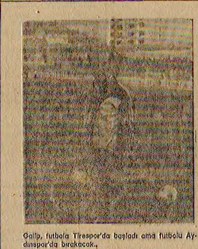
Galip, futbola Tiraspor'da başladı ama futbula Aydınspor'da bırakacak.

Abone koşulları: Yurt İçi Yıllık 750 TL - 6 aylık 400 TL - 3 aylık 200 TL