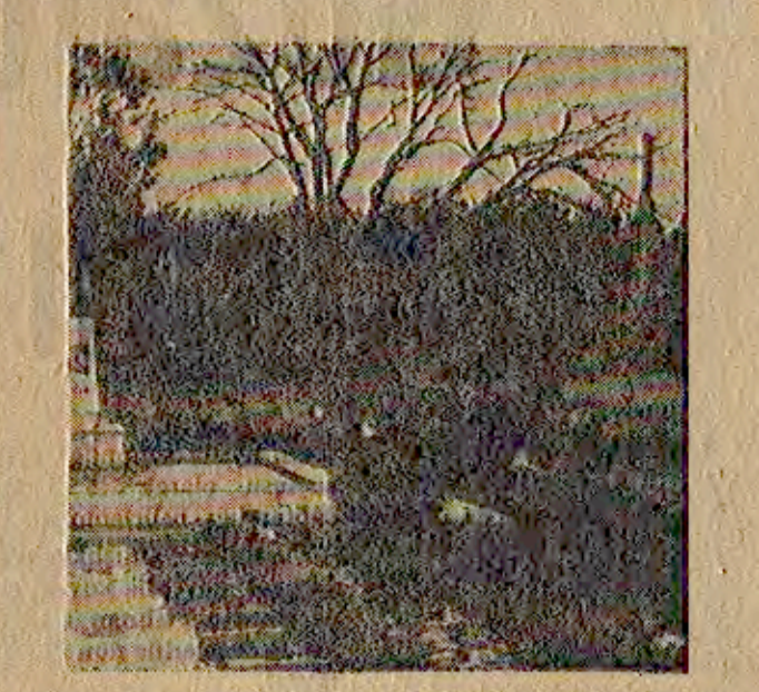
Yıldız 10 milyon fidanın yetiştirildiği Bolu İl Fidanlığı görülüyor.