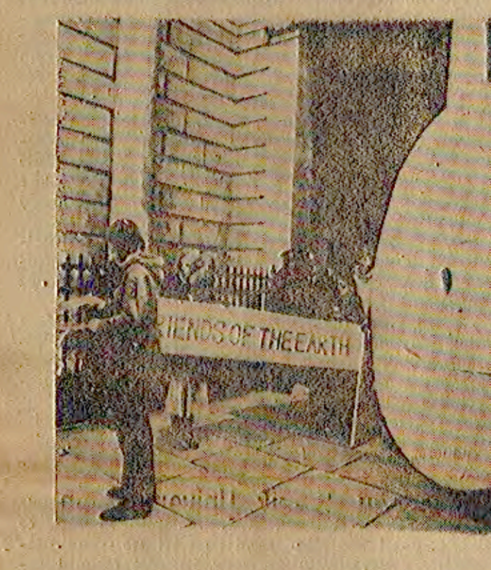
Yeryüzünün Dostları derneğinden protesto eden gençler, İçişleri Bakanlığının önünde değirmen taşı ile, yeni kurulan nükleer santralla ilgili bir raporun dağıtımını istiyorlar.

İskoçya'da nükleer santral kurulmasına karşı çıkan bir arup kocaman bir değirmen taşı ile gösteri düzenlediler. Kanada'da bir reaktörü temizleyen iki işçi yüksek dozda radyasyona uğradı.