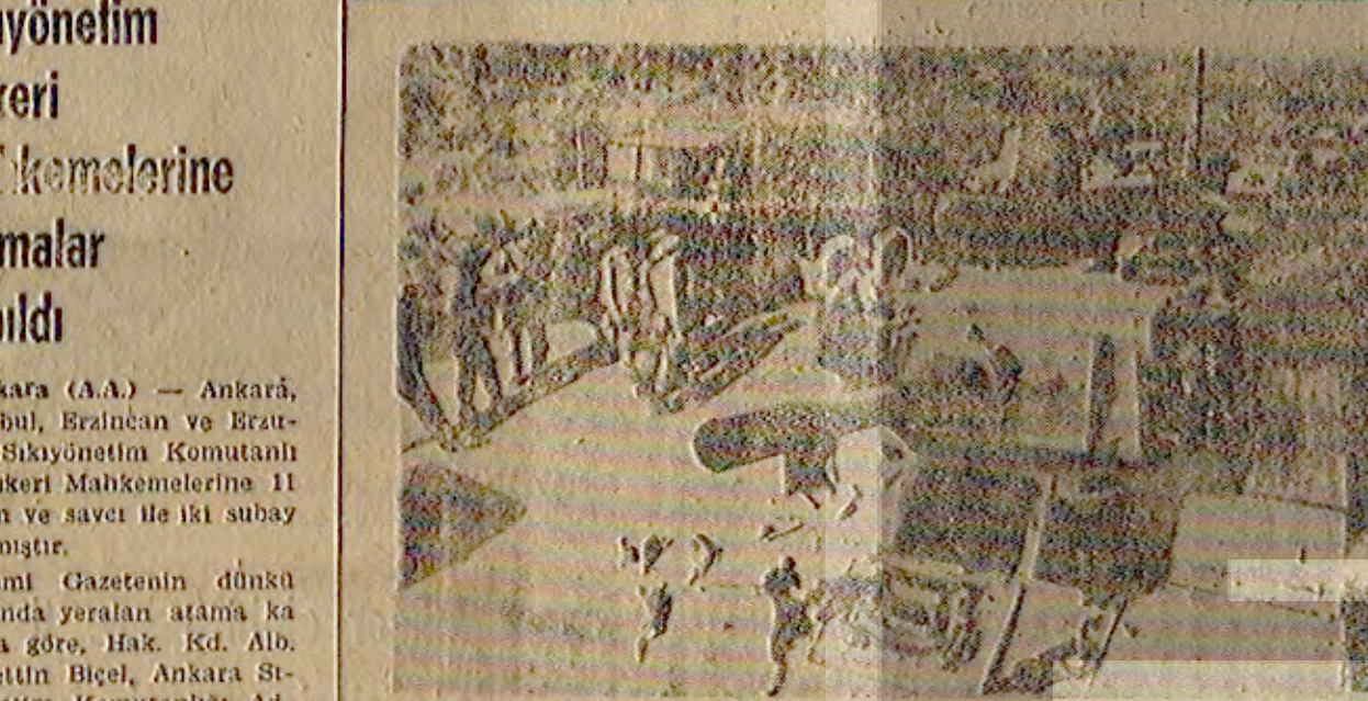
BM Barış Gücünün elinde bulunan Lübnan topraklarını idare eden Binbaşı Müdir Malinin askerleri hareket halinde görüntüsü.

Lübnan'da kurulan devleti henüz tanyan ülke çıkmadı LÜBNAN'DA KURULAN DEVLETİ HENÜZ TANYAN ÜLKE ÇIKMADI. Lübnan'da kurulan devleti henüz tanyan ülke çıkmadı. DİSK MÜDÜRÜ'NÜN CENAZESİ DÜN TÖRENE KALDIRILDI DİSK MÜDÜRÜ'NÜN CENAZESİ DÜN TÖRENE KALDIRILDI. DSK Müdürü'nün cenazesi dün törene kaldırıldı.