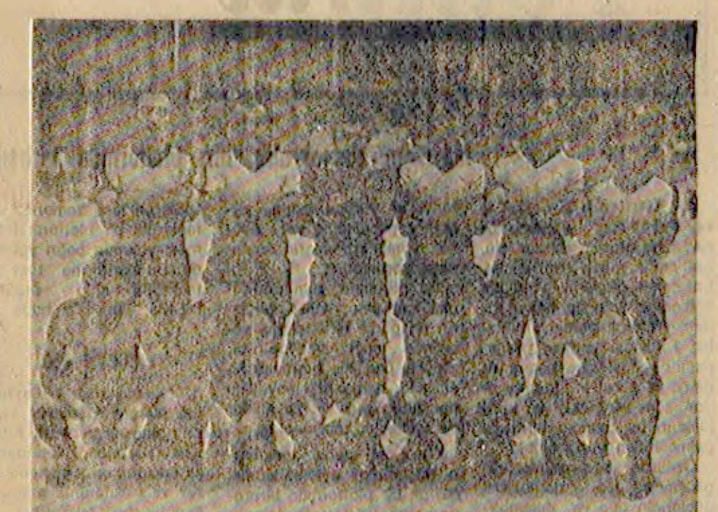
Giresun'un Bulancak ilçesindeki takımın yöneticileri Bölge Müdürlüğüne başvurarak Bulancak'taki takım sayısını sınırlandırmamış istenmişlerdir. Fotoğrafta, Bulancakspor futbol takımı oyuncular topla halde. (Foto: ABC)

GİRESUN (ABC) Giresun amatör kulübünde iki, ikinci kümesinde de bir takımın bulunması Bulancaklı futbol takımlarının yöneticileri Giresun Bölge Müdürlüğüne başvurarak Bulancak'taki takım sayısını sınırlandırmamış istenmişlerdir. Fotoğrafta, Bulancakspor futbol takımı oyuncular topla halde. (Foto: ABC)