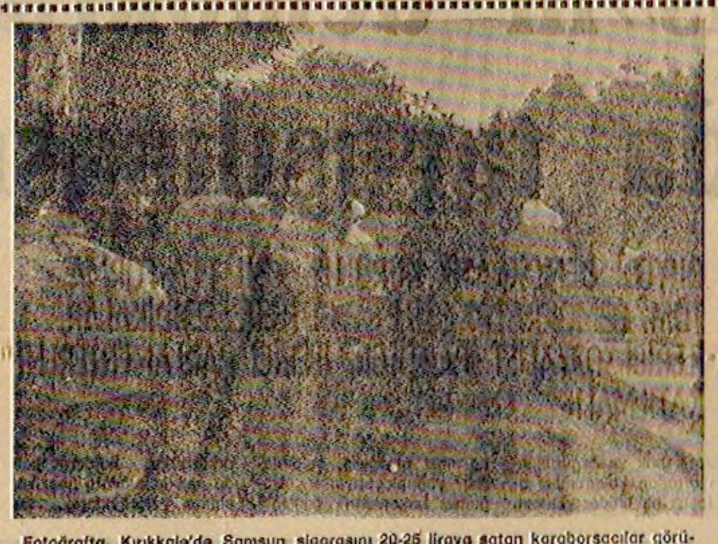
Fotoğrafta, Kırıkkale'de Samsun sigarasını 20-25 liraya satan karaborsacılar görülüyor.

KIRIKKALE NİHAyet BİR DOĞUMSPORUNA KAVUŞUYOR SİNEMALAR Beyoğlu 11.00 - 12.35 - 13.30 15.20 - 16.25 - 17.55 - 19.20 - 21.15 • DÜNYA: (49 93 61) Çingene 12.00 - 14.15 - 16.30 - 19.20 - 21.15 • FİYAT: (49 93 61) İlk Voleybol 12.00 - 14.15 - 16.30 - 19.20 - 21.15 • EBİRK: (44 24 39) Tehdit 12.00 - 14.15 - 16.30 - 17.45 - 21.15 • ELHAMRA: (44 22 36) Sari Emanet - Hong Konglu Baba 11.00 - 21.00 • LARZ: (44 35 35) Güneşli Bataklık 12.00 - 14.45 - 16.30 - 18.45 - 21.15 • SES: (45 24 19) Kızın Savaşçı - Günah Melezi: 11.00'den sonra devamı • SİNE POP: (44 24 23) Sıra • UNAL: (44 93 05) Ceylan - Sarhoş 13.30 - 15.30 • YENİ MELİK: (44 42 99) Kaada 14.00 - 14.45 - 16.30 - 18.45 - 21.15 • ZAFER: (44 93 05) Ceylan - Sarhoş 13.30 - 20.30 • AS: (47 53 15) Karayın • KONAK: (48 25 09) Çüned Balkan Film Şenliği 11.00 - 12.45 - 14.45 - 17.00 - 19.15 - 21.30 • İNOL: (40 46 95) Dertli Pınar 12.15 - 14.15 - 16.30 - 18.45 - 21.30 • Ç: (40 46 95) Pınar 11.00'den sonra devamı • ŞAN: (40 97 93) Kaybolan Yıllar İstanbul • YUMURCAK: (51 01 00) Kara Garipali Gelen - Aş Gönül Mehmet 11.00 - 13.00 - 15.30 - 18.00 - 20.30 • BULVAR: (21 35 78) Sultan 11.00 - 13.00 - 15.00 - 17.00 - 19.00 - 21.00