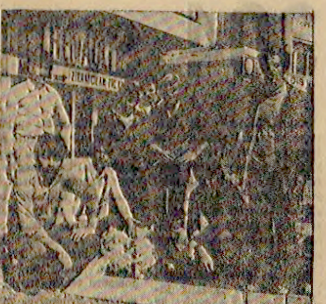
Aydın Belediyesi tarafından betonlama çalışmalarına başlanmadan önce kurban kesilene.

Aydın Belediyesi yolların betonlanmasına kurban keserek başladı