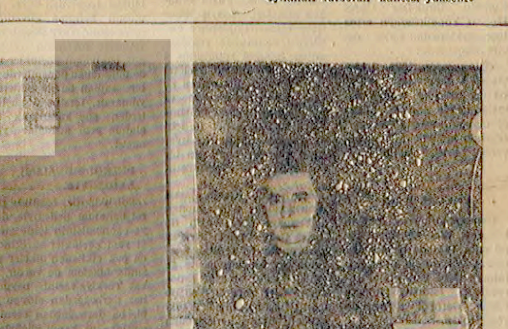
Kırıkkalespor'un başarısızlığına neden olanların utansızca görevini sürdürüyor.

Giresun'da amatör klüp sayısının sınırlandırılması istendi