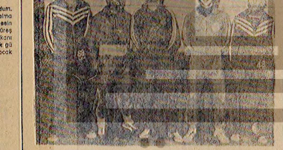
Sakarya'dan Genç Millî Güreş Takımına çağrılan Güreşçiler toplu hatta görülüyor.