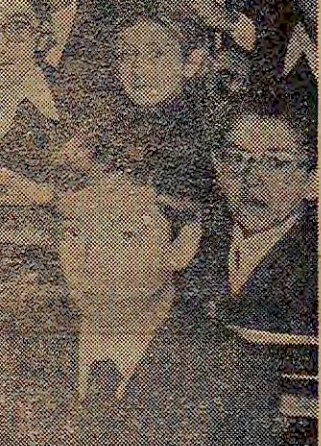
«Eğitim ben bir devlet daire-

«ANNE BANA DERS ALDIRABİLMEK İÇİN EĞİTİMLERİNİ GAYRIYOR. BUNLARIN FARKINDAYIM»