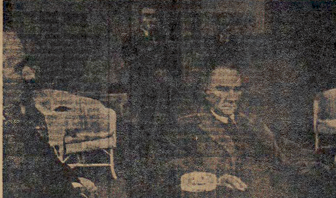
Mustafa Kemal son günlerinde, yakalanan dünya savaş tehlikesini görüyor; bu savaşta Türkiye'nin yerini yanlış belirlememesi ve kendisinin de enayata mahkûm kalması...