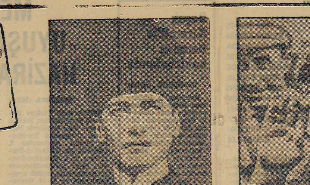
Lenin'in Mustafa Kemal hakkındaki bazı değerlendirmeleri... Mustafa Kemal Paşa tabii ki süzgeçten geçirilmeli. Ama günümüzde ki, iyi bir örgütleyici, yetenekli bir lider. O'na, yani Türk halkına yardım etmemiz gerek.