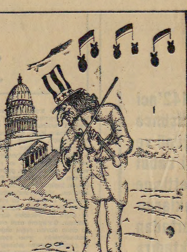
Yeni bir yaşam

METAL İŞÇİLERİ MESS UYUŞMAZLIĞINI VE 15-16 HAZİRAN'I DEĞERLENDİRDİ