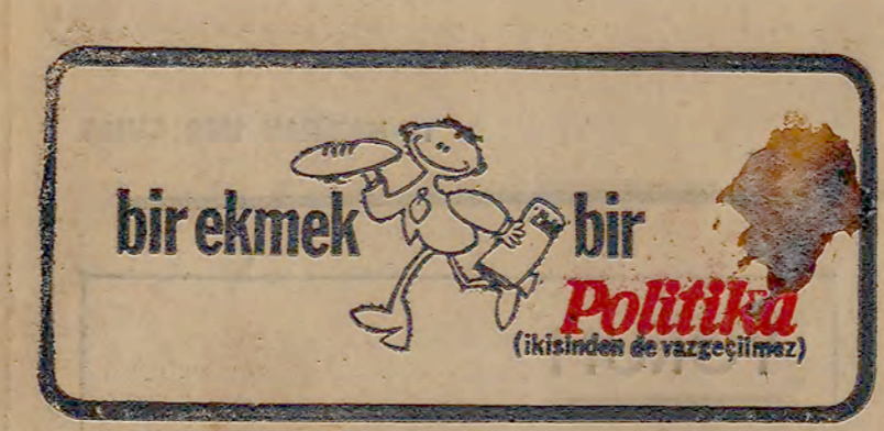
Fiyatı 250 kuruş

«Eğitim düzenimiz gençlerimizle üniversiteye girmeye zorlamaktadır. Yine yüzbinlerce genç okutluca ve eğitim sistemimizin yüzölçümüne göre seçilmiş görüşler getirilecek. Bu yıl sınavlara resmi açıklamaları göre 374 bin öğrenci olarak aday olacak. Yükseköğretim kurumlarının kapasitesi ise, en zorlanmış şekilde 70 bin olacaktır. Demek ki 300 binden fazla genç yine okutluca kalacak. Sınavlara katılanların bu bölümünün istemedikleri ama bir yere gitmiş olmaları için zorunlu olarak döviz etkileri her okutluca okutulan öğrenciye ödünç olarak veriliyor. Bu okutulan öğrencinin kapasitesini karşılayamaz, yüzbinlerce de tercih edilmiş bir bölüme devam edecek.»