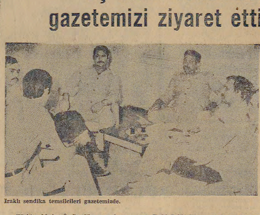
Iraklı sendika temsilcileri gazetemizde.