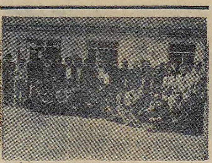
Yeni-İz işçileri toplantı halinde.