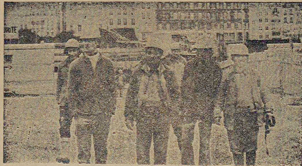
FİDEF, Emeklilik Tasarısının değiştirilmesi için mücadele ediyor. Türkiye İşçiler emeklilik haklarını koruma savaşını veriyorlar...