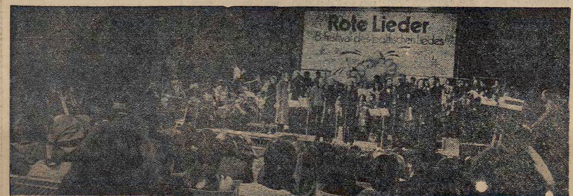
8. Politik Şarkı Festivali'nden bir görüntü...