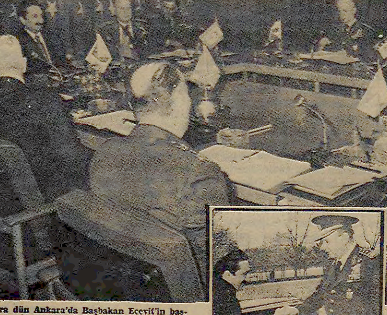
Yüksek Askeri Şûra dün Ankara'da Başbakan Ecevit'in başkanlığında toplandı...