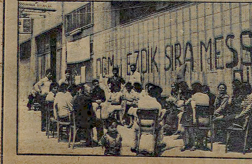
Kadınlarımız grev yerlerinde...

Metali işçilerinin 8 ay süren zorlu ama yararlı grevi, geçimimize gülerim dedi. Grevci eşleri büyük Grev zamanı sabah erkten bu mutlu zafer günlerinde, berber gibi, 8 aylık savasımı değerlendiriyor.