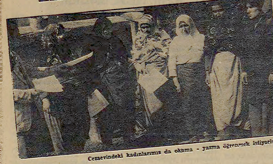
Cesaretindeki kadınlarımız da okuma - yazma öğrenmek istiyorlar...