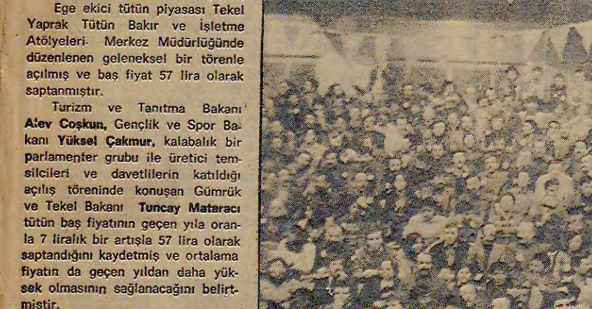
İSMM (İSTA) Ege ekici tütün piyasası... Yaprak Tütün Bakır ve İletme (Atölyeleri) Merkez Müdürlüğünde...

Törende konuşan Gümrük Bakanı Mataracı rekoltinin bu yıl 248 bin ton düşüldüğünü söyledi.