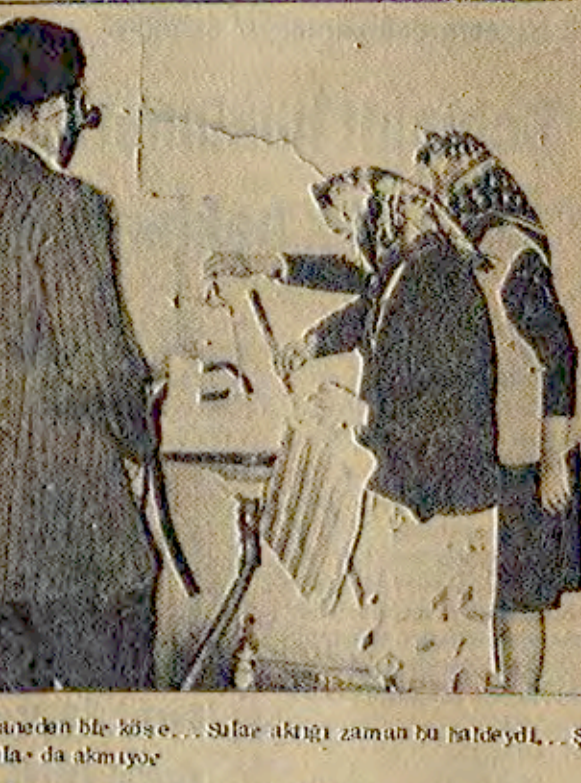
İstanbul'da bir köyün suları akmayan Ege Üniversitesi Hastanesinde hastalar zor durumda kaldı.

İzmir'deki heyelanda evleri yıkılanlar, Buca'daki sosyal konutlara yerleştirilecek. Bu kararın alınmasıyla afetzedelerin sorunları çözümlenecek.