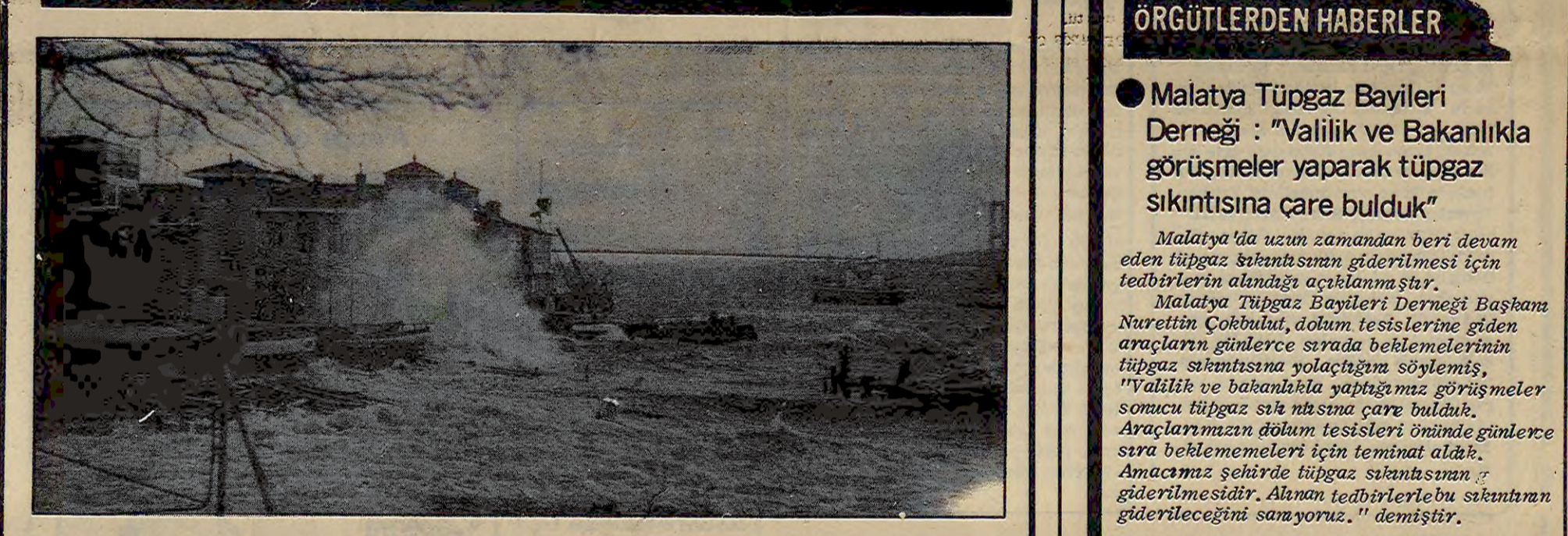
Hızı saatte 70 kilometreyi bulan fırtına İstanbul'da ulaşımı aksattı

Hızı saatte 70 kilometreyi bulan fırtına İstanbul'da ulaşımı aksattı. Fırtına nedeniyle ulaşım aksadı.