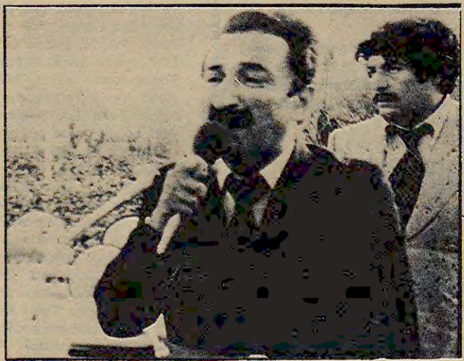
Bülent Ecevit mitingde konuşma yapıyor.

CHP Genel Başkanı Bülent Ecevit İstanbul'da Mecidiyeköy'de konuştu. Anayasa ve yerel seçimler hakkında konuştu.