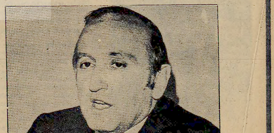
CHP Genel Başkanı Necmettin Erbakan'ın Çanakkale'de yaptığı konuşma...