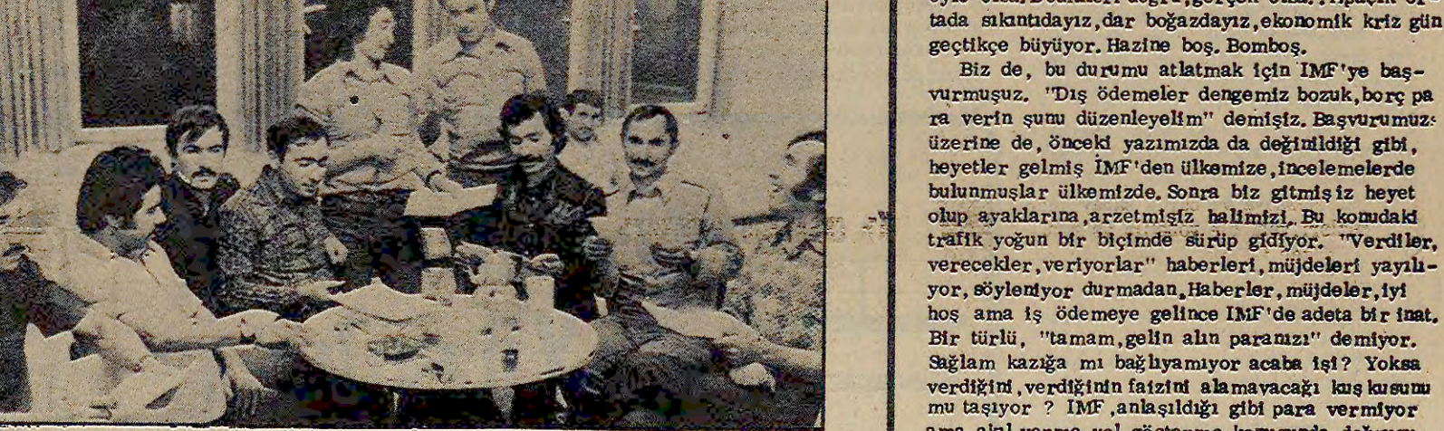
Maden-Magyas işyeri lokalinde işçiler toplu halde "Vatandaş Mektubu"nu okuyor