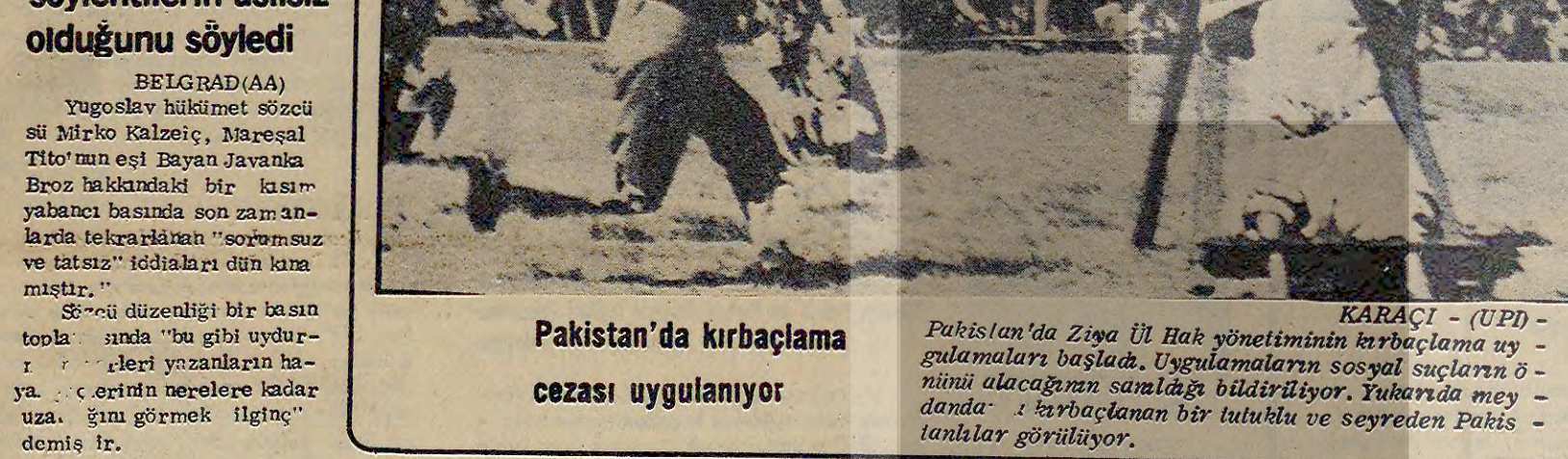
Pakistan'da kırbaçlama cezası uygulanıyor