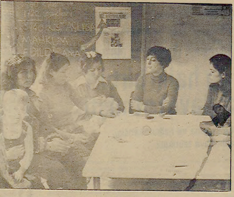
İşçi eşileri basın toplantısında