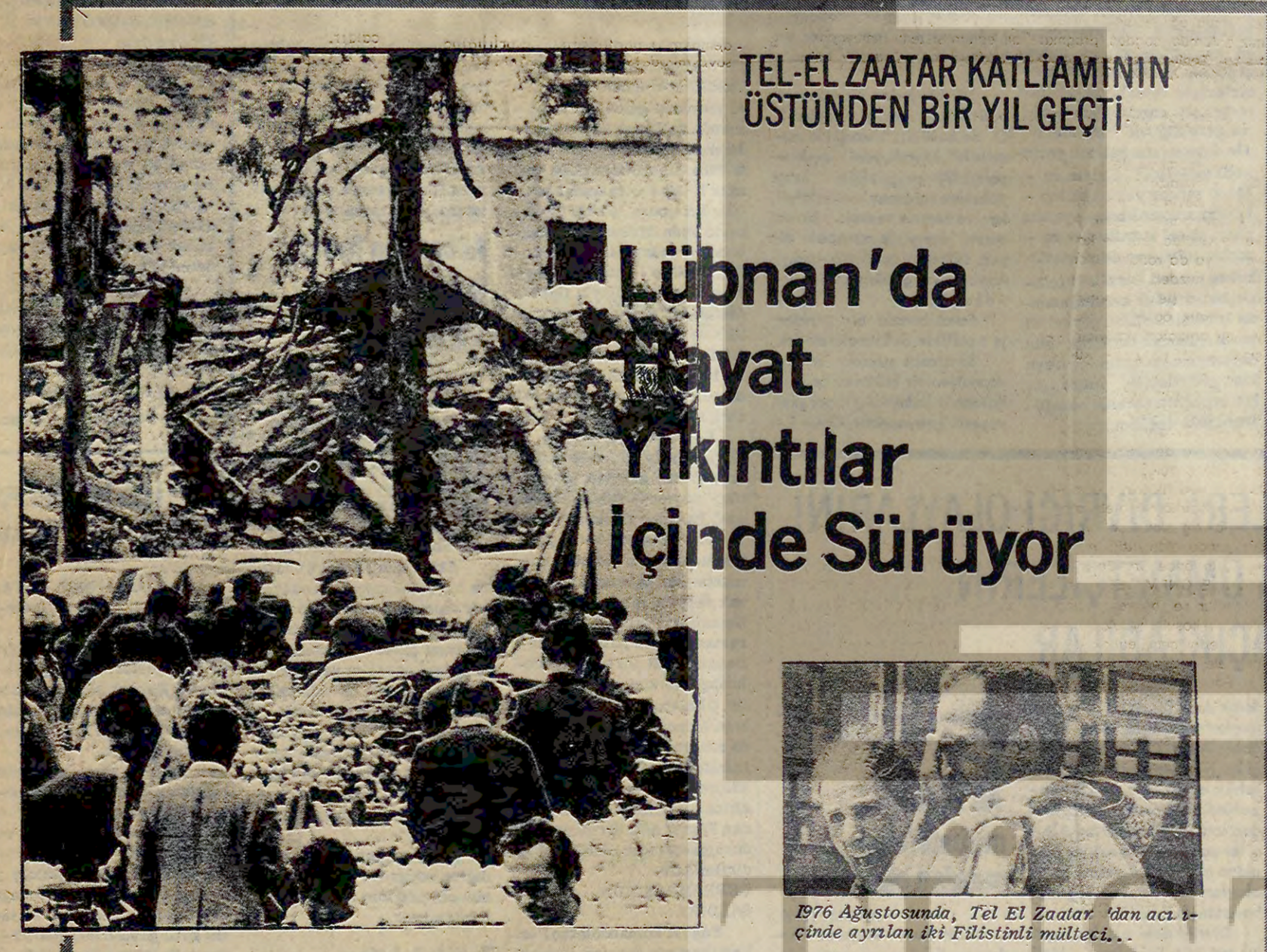
1976 Ağustosunda, Tel El Zaatar'da bir yıl önce meydana gelen deprem sonrası...