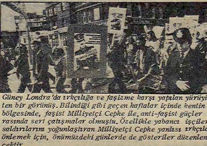
Güney Londra'da faşizmle karşılaşılan bir grupun, faşizmle karşılaşılan bir grupun, faşizmle karşılaşılan bir grupun...