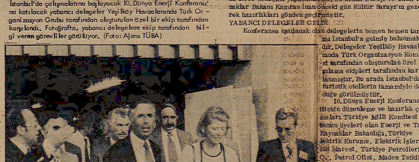
İstanbul'da gerçekleştirilen 10. Dünya Enerji Konferansı'nın açılış töreni. Başbakanın başkanlığında...