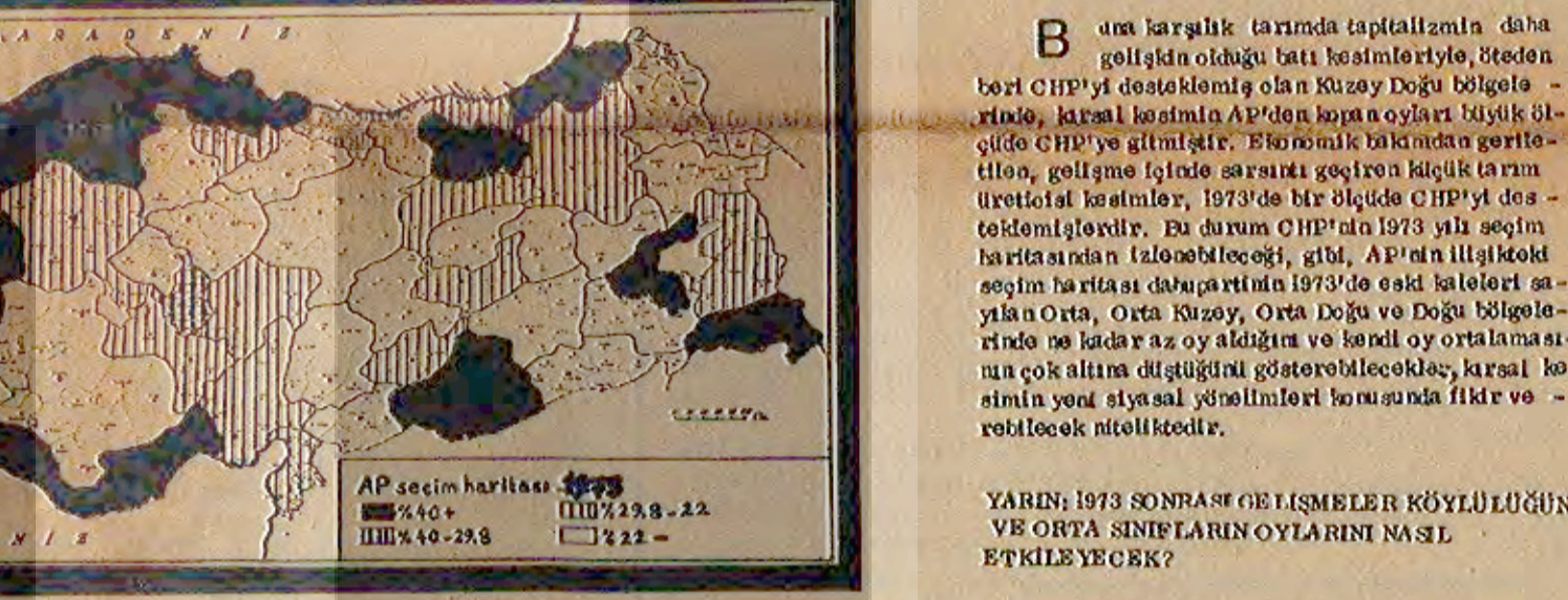
1973'de köylülük nerelerde CHP'ye oy verdi

İSTANBUL-(İSTA) - 1969'dan 1973'e köylü seçmenlerin oyları nasıl gelişti?