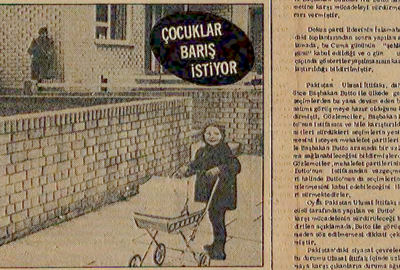
Çocuklar barış istiyor. (Children want peace.)

İSLAMABAD-(ANKA-DPA) - Pakistan'da muhalefet partileri Ulusal İttifak'ın Butto yönetimine karşı çıkmaya devam ediyor. Ulusal İttifak içinde uzlaşma düşmanları ağırık kazandı.