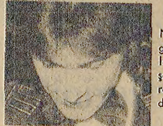
Neco, ilginç giysileri ile bu akşam yine ekranlarımızda.