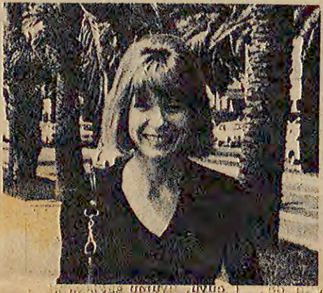
Shirley Mc Laine

"Trocedero Balesleri" adlı ilginç bir dans topluluğu, New York'ta gösterilerini sürdürüyor. Topluğun ilginçliği ise, sık sık kadın kılığına giren 10 erkekten kurulu olması ve gerek klasik gerek modern baleleri mizah açısından yorumlamasından ileri geliyor. Ünlü film yıldızı Shirley Mc Laine'de bu 10 erkeğin arasına katılmaktan kendini alamamış.