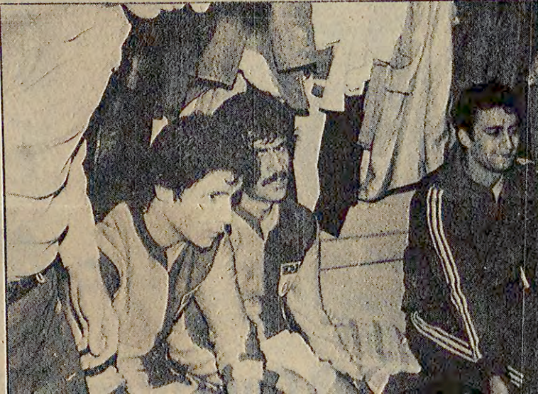
Antrenman yeri bulamamaktan yakanan Galatasaraylı futbolcular Ali Sami Yen Stadı'nda daha önce yaptıkları bir çalışmada sonrasında görülüyorlar.

Bu koşullar altında idman sahası ararken antrenman yapmış kadar yorulduklarını belirten Galatasaraylı futbolcular derinlerini şöyle dile getiriyorlar. "Beden Terbiyesi İstanbul Bölge Müdürlüğü yetkilileri Altınzade sahasını bize kapatırlar. "Acaba bu futbolcular nerede çalışırlar?" diye diğiltidiller mi çok merak ediyoruz. Ali Sami Yen Stadı'nın betonu andıran zeminiyle çalışmaktan sağlam tarafımız kalmamıştı ama seçim hakkımız olmadığını için idare ediyorduk."