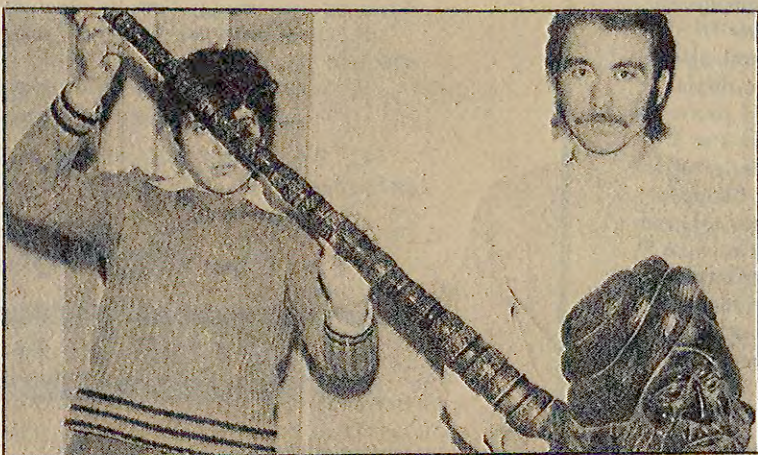
Boyu kadar pipo yapan bir pipo imalatçısı.