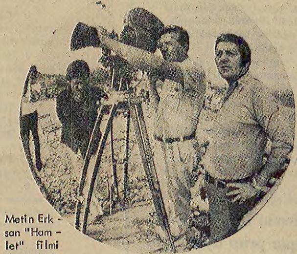
Metin Erksan "Hamlet" filmi ile de iddialı olduğunu söylüyor.

Metin Erksan "Hamlet" filmi ile de iddialı olduğunu söylüyor. Metin Erksan "Ben kendim için film yaparım. Bu benim doğal bir yarımdır. 5 televizyon dizisi için, bütün masraflar dahil, sadece 948 bin lira harcadım. Fakat Aziz Nesin, Bekir Yıldız, Tarık Buğra'nın hikâyelerini seçemediğim için, bu yazarların hücumuna uğradım. Televizyona yeni filmler hazırla yacağım. Ellerinde ben-den satın aldıkları pek çok Türk filmi var. Bazı filmlerim, halkın arzusu üzerine, iki, hatta üç defa gösteriliyor. 1979'dan sonra, dünya piyasasına açılacağı için, demektir. Sinema ve Televizyon Enstitüsünde ders veren ünlü rejisör (Türkiye'de ilk kadın oyuncu Fatma Girik'tir, kendisinin sanatına sonsuz saygım var, en iyi yazar-hikâyeci Kemal Tahir, en iyi görüntü yönetmeni de Çetin Tunca) demektir. Yarıda (Ana Kalbi) adlı bir filme başlayacak olan Metin Erksan, ikinci esinden de boşanarak, kendini tamamen mesleğine adanmış.