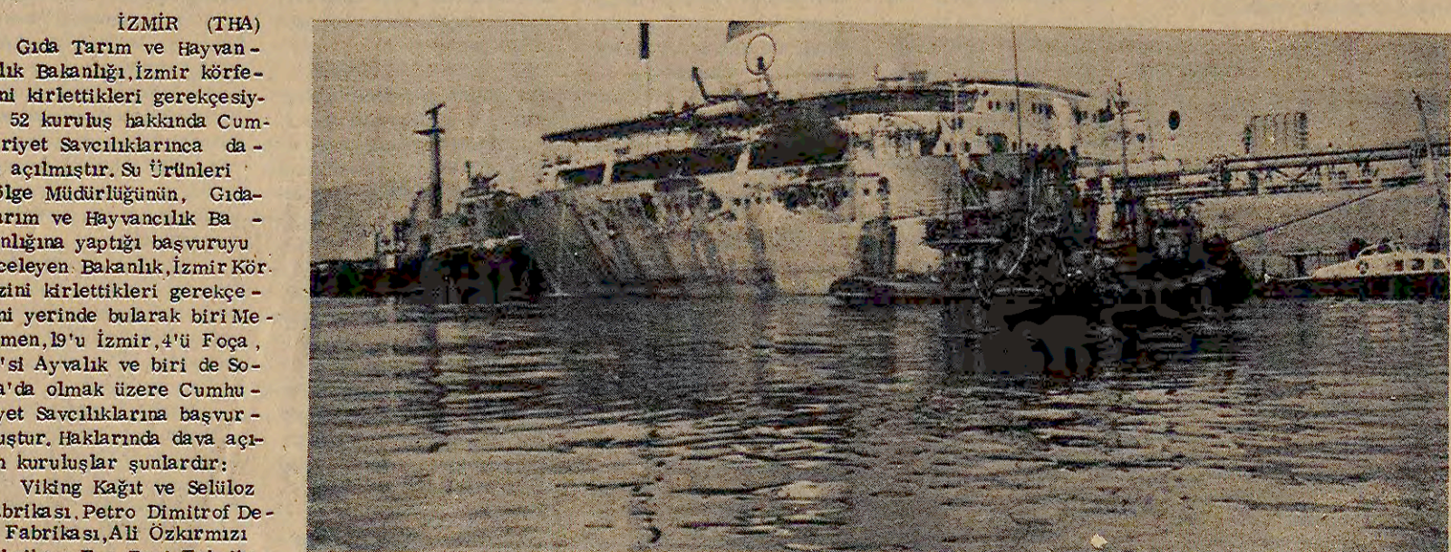
İzmir Körfezi çevresindeki sanayi kuruluşlarının yatacağı deniz kirlenmesini bir süre sonra İzmir Körfezi haline benzeteceği belirtili...