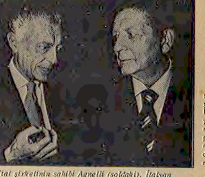
İtalyan Komünist Partisi liderlerinden Giorgio Amendola ile görüşüyor.

İber ORTAYLI... "Ben de bir gençmişim..."