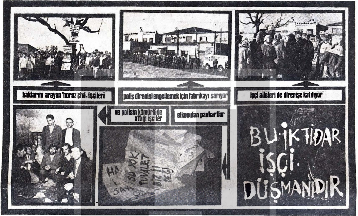
haklarını arayan 'horoz çivi' işçileri