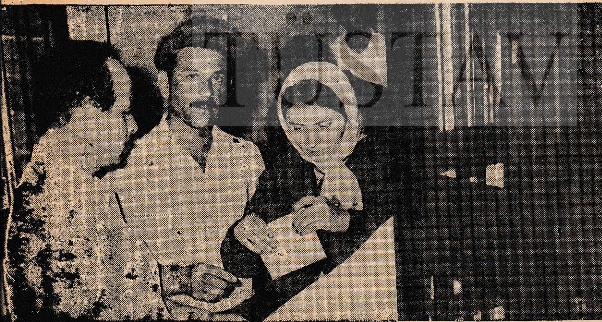
Oylamada işçiler işveren, Türk-iş iktidar üçlüsünü mağlûbetti.