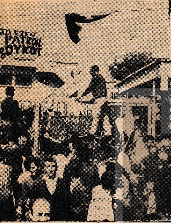
Fabrika işgal ediliyor