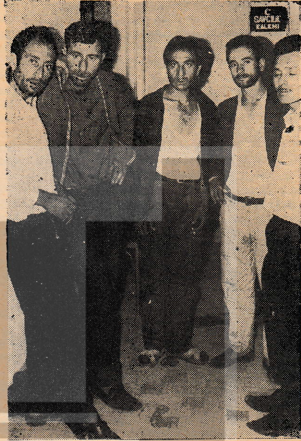
İşçiler mahkemede serbest bırakıldı.