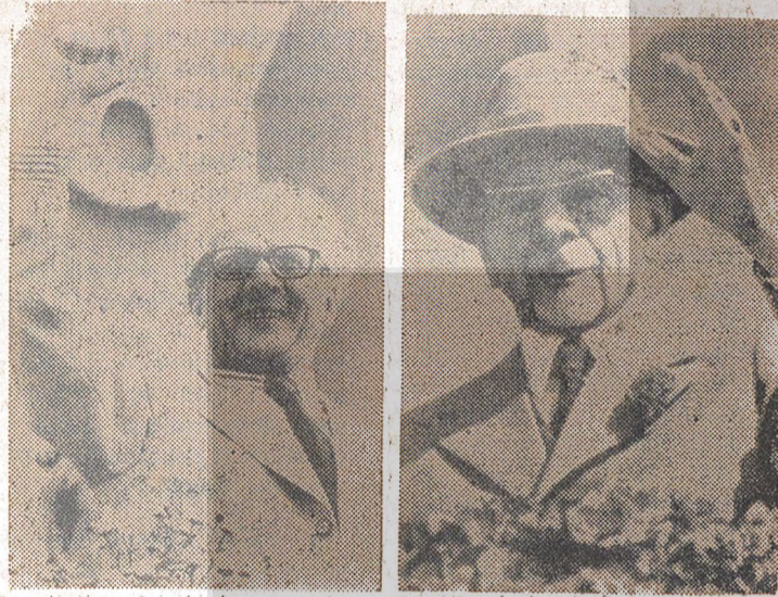
ERICH HONECKER SED Birinci sekreteri

dönüşüm sonucunda kurulan Demokratik Alman Cumhuriyeti, aynı zamanda batılı emperyalistlerin işgali altındaki kesimler. de kurulan devlete de bir cevap olmuştur. Böylece, emperyalizmin gerici çevrelerine ve Batı Almanya'da yeniden güçlenen tekelci sermayeye bir darbe indirilmiştir. Demokratik Alman Cumhuriyeti'nin kurulması ve bağımsız bir Alman sosyalist devletinin ortaya çıkması emperyalizm için büyük bir yenilgi olmuş, emperyalizmin gerici yayılma ve istila planları suya düşmüştür.