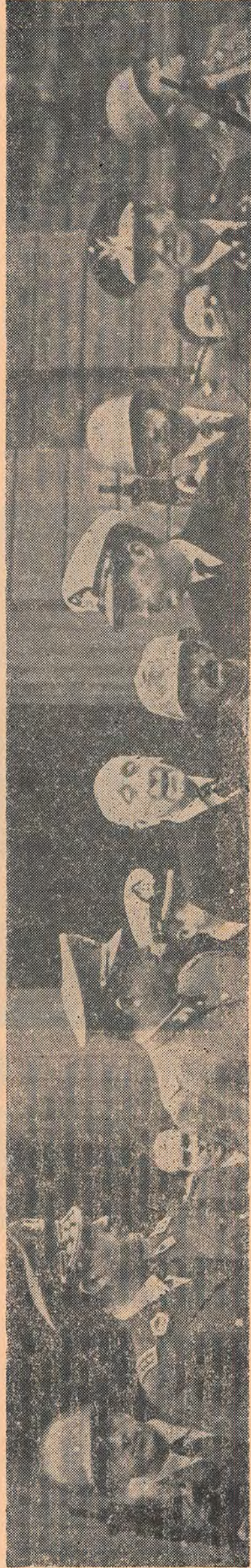
Pnochét ve çetesi: Döktükleri kanı boylatacaklar, Şili emeççilerinin öcü bu emperyalist usaklarında kalıyacak.

«İşçilere sadece şunu söyleyebilirim: Vazgeçmeyeceğim.