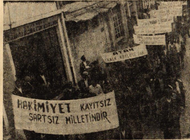
Köylüler ürettikleri ürünü yok pahasına kapatan araçlara ve onların iktidarına karşı hep birlikte yürüyorlar.

Halk için, gerçekten hürriyet için Bağımsız, özgür bir Türkiye için Çelik imanla yürüelim biz Su katılmamış yurtseverleriz.