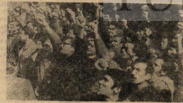
Gençlik, Mustafa Kemal'in Millet Meclisi önünde emperyalizm ve işbirlikçileriyle mücadele andı içiyor.

Grevin görülen en önemli sebebi 1 Ağustos tarihinde va pılan toplu sözleşmenin uygu lanmamasıdır. Uzunzamandan beri işverenle anlaşamayan iş çiler nihayet ilk silâhları olan greve başvurmuşlardır. İşve ren 1970 yılının ilk ayından itibaren işçi ücretlerini ver meyip, bu parayı başka iş sa halarında sermaye olarak kul (Devamı S. 3'de)