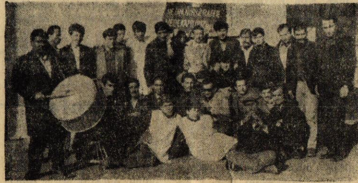
Tokes işçileri Lokavta direniyor

İzmir Karabağlar'da Maden — İş'e bağlı Tokes Keçe Fabrikasının 53 işçisi patronun lokavta karşı hep bir ağızla direnmektedirler. Patronun işçileri hergün işten atma tehdidine ve lokavta karşı direnen işçiler, ayrıca ücret zammı da talep etmektedirler. Patron, hammaddenin karaborsadan alınmasını gerekçe olarak göstermekte ve böylece işçileri işten çıkarılmaktadır. İşçiler artık hep birlikte, çelikten bir dayanışma içinde olmak ve direnmek gerektiğini anlamış durumdadırlar. Patronun işçiler arasında ikilik yaratmak çabaları f.yaskoyla sonuçlanmaktadır.