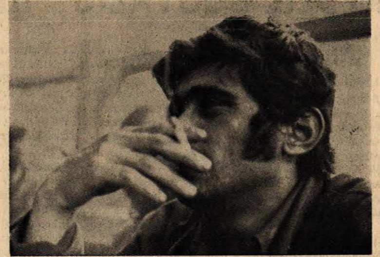
Maden işçisi efkârlı!