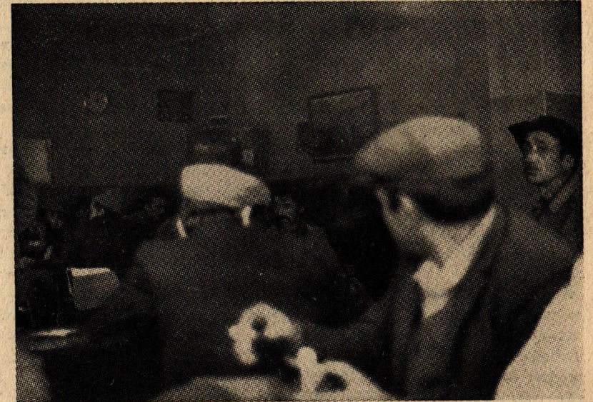
İşçiler dumanlı kahvelerde oturuyor.

Cevap : Eskilerde iş yok. Gençlere bakalım.