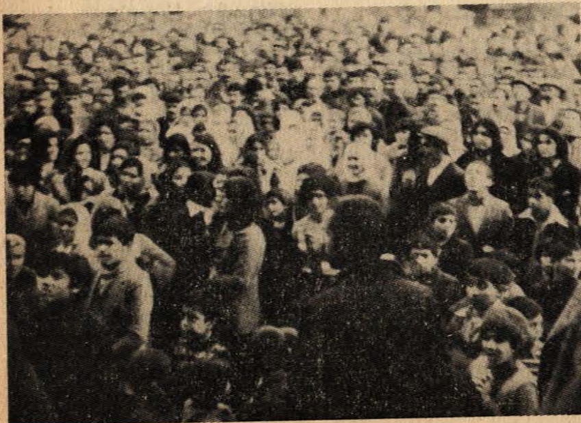
PTT işçileri iktidarı ve işvereni protesto ediyorlar..