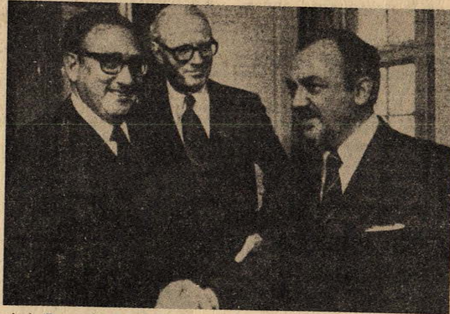
Resimde Danimarka Başbakanı JØRGENSEN (sağda) tarafından karşılanan KİSSİNGER (solda) görülüyor. JØRGENSEN sosyalist partiler zirve toplantısında alınan kararlar hakkında KİSSİNGER'e «tekmil» vermiştir.

sası kabul edilmelidir. Sendikalar kapatılmalı ve tek sendika sistemine geçilmelidir. Sendika yöneticileri üzerindeki devlet baskısı artırılmalıdır. Yöneticilere cezai ve maddi bakımdan sorumluluk yüklenmelidir. Grev hakkı sırası kayıt altına alınmalıdır.