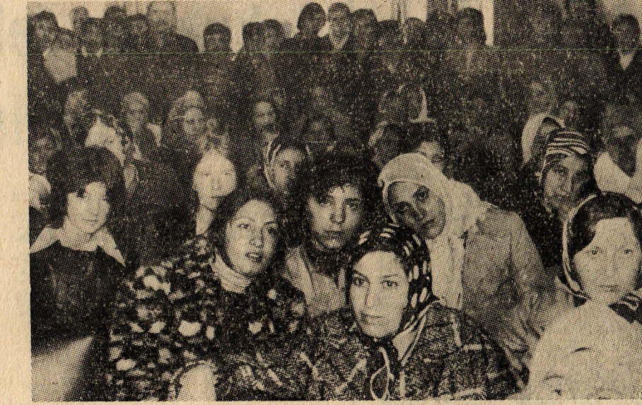
Patronların sömürü ve saldırısına uğriyan Diktaş işçileri..

İşveren, işçilerin DİSK'e katılmalarını önlemek için çeşitli tertiplere başvurmuştur. Ancak işveren netice alamayınca fabrikaya 20 kadar komando yerleştirmiştir. Bu komandolar vasıtasıyla işçileri yıldırıma çalışmıştır. Komandolar kadın işçilere sataşarak olay çıkartmaya çalışmışlardır. Ancak iş-