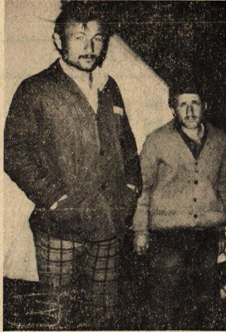
PTT işçileri direniş çadırı önünde.