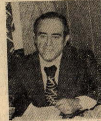
Sabancı Holding İdare Meclisi Başkanı SAKIP SABANCI

lirayı bulmaktadır. Bu rakam 1977 yılında 9 milyar lirayı aşacaktır. Sabancı Holding bu varlığına, yabancı şirketlerle işbirliği halinde işçileri sömürerek ulaşmıştır. İşbirliği yaptığı uluslararası şirketler büyük Amerikan, Avrupa ve Japon tekelleridir. Bunları başlıcaları şunlardır. FORD MOTOR ŞİRKETİ, kimya sanayisinde söz sahibi ICI adındaki şirket, kauçuk ve plastik sanayisinde söz sahibi DUPOND adındaki şirket, GOODRICH, UNIROYAL, GOODYEAR gibi lastik üreten uluslararası şirketler, motor sanayisinde söz sahibi olan NISSAN adındaki Japon şirketi, ağır sanayide söz sahibi olan IHI adındaki Japon şirketi.