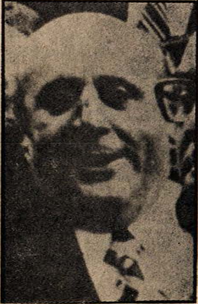
Süleyman Demirel - Saldırıdan haberi var mıydı?

Geçen hafta kamuoyunu en fazla meşgul eden olay, başbakana yapılan «saldırı» oldu. 13 Mayıs 1975 Salı günü saat 14.00 de biten Bakanlar Kurulu toplantısından sonra gazetecilere bil-