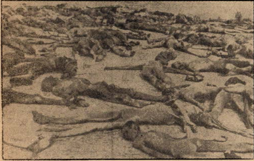
Resimde Alman Faşizminin toplama kamplarındaki vahşetlerinden biri görülüyor.

250 milyon Sovyet insanı adına dünyamızın geleceğine değer ve-ren herkese sesleniyoruz. Bu geleceğin barışçı olması için gerekli bü-tün gayreti gösterelim.»