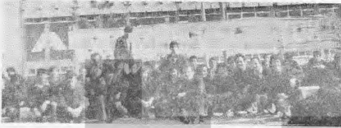
— İşçiler ön safta

Olayları «sağ - sol çatışması» olarak değerlendiren ve «tarafsızlığını ilân eden hükümete gösterilecek anarşi kaynağı da bu olur, DİSK ve TÖB-DER!