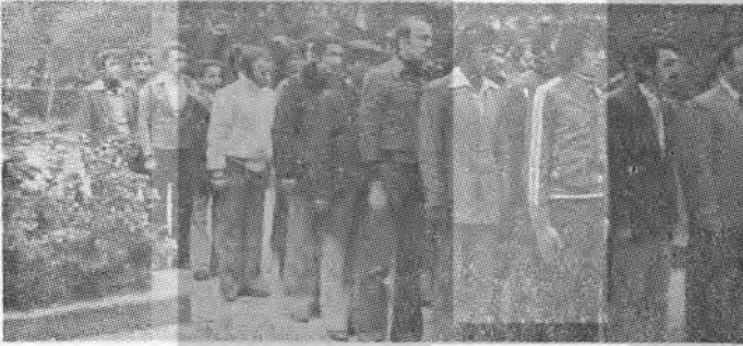
— Hayat onların ellerinde.

Bütün bunlardan, Ecevit'in, demokrasi güçlerine karşı takındığı tavırdan gerici ve faşist güçlerin ne denli umuda kapıldıkları görülmektedir ve bu umutlarında da haksız değildirler. Ancak, demokrasi güçleri, eylemin amaçlarını direnişten önce belirleyip açıkladıkları, bunun, faşizme «İhtar» ve faşizme karşı demokrasi mücadelesinde kararsızlığından dolayı da hükümete «uyarı» niteliğinde bir girişim olduğunu ilân ettiler. Aslında demokrasi güçlerinin gerici saldırılar karşısında özgürlükler için güvence olarak