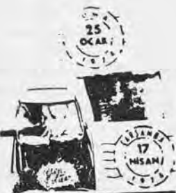
Başbakan: «Demirel bunalım kışkırtmacılığı yapıyor»

CHP Parti Meclisi, koalisyonun geleceği için bugün de toplandı 19 MAYIS Başbakan Ecevit, Parti Meclisine ara verdikten sonra Korutürk'le görüştü