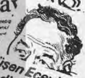
«Ecevit'le Erbakan, koalisyonun kaderi için görüştiler»

«Bu iş bitmiştir Çakar yol seçindir. MSP hiç bir tüzit veremeyecektir» «Ecevit'le Erbakan, koalisyonun kaderi için görüştiler»