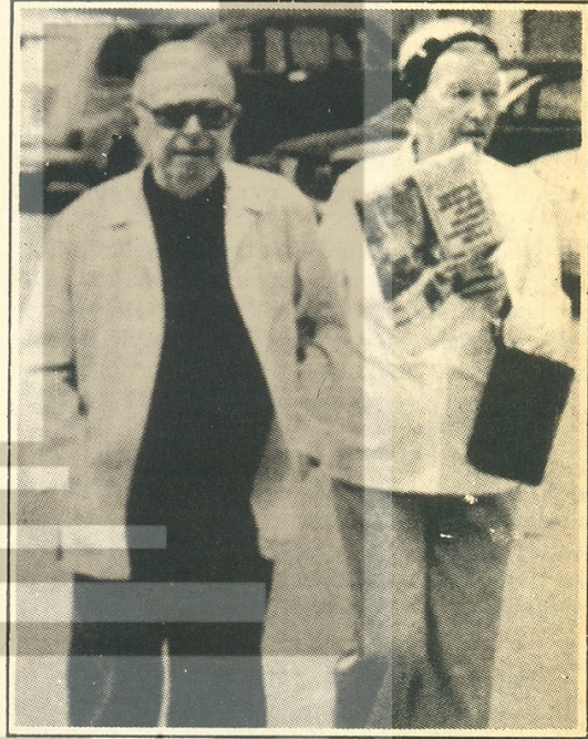
Simone de Beauvoir, Sartre ile birlikte...

Baskının bütün temel mitoslarını teker teker yıktı: kadınların entellektüel zayıflığı, cinsel edilgenliği, annelik içgüdü. Kadınlığın ne olduğunu değil, nasıl kadın olduğunu araştıran Beauvoir, dünyayı kaba bir ikilemin içine hapsetmek istemiyordu: Bir tarafta korkunç baskıcı erkekler, karşıt kampta sempatik kurbanlar. Çünkü köleyle sahibi arasındaki diyalog, birarada yaşamaya mahkum erkekle kadın arasında en gelişkin düzeyiyle kendini gösteriyordu. Beauvoir her kadına "sadece" bilinçli bir özne olarak yaşama fırsatını sunuyordu. Önceleri Kadın 'ı yazmayı düşünmüyordu : İlk Hatıralar 'ını yazmaya oturduğunda "kadın olmanın" ne anlama geldiğini merak edince bunu yazmaya mecbur oldu. İlk bakışta saçma gibi gelen -en azından o tarihlerde (1949)- bu soru, tahammül edilmez bir ezilmişliğin bilinciyle onu açıklayabilecek nitelikte tutarlı bir teoriyi