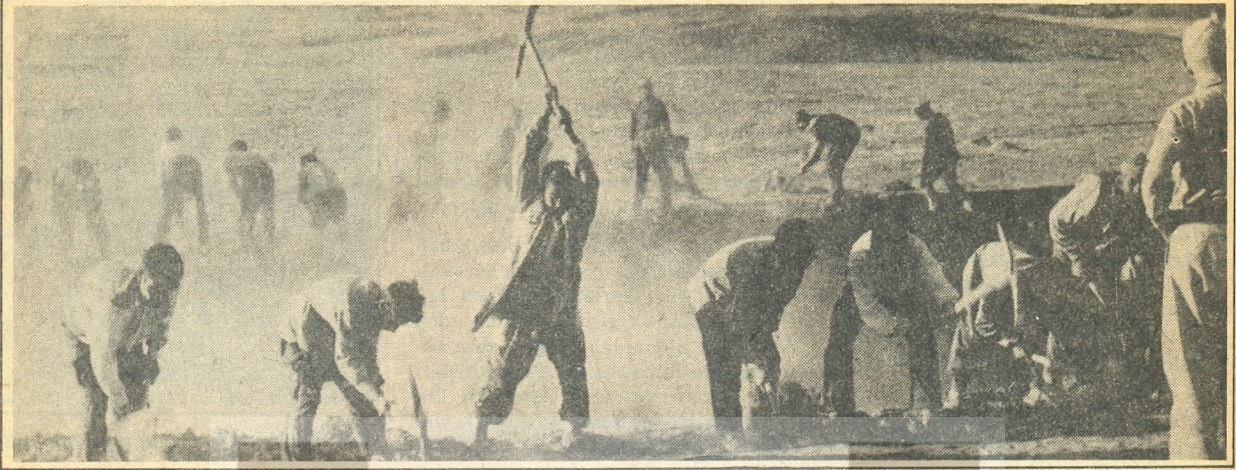
Teknolojik gerilikten ötürü işçi emeği yoğun bir şekilde kullanılıyordu.

etrafında örgütlenmeye başladılar. Bu dönemde sosyalist hareketle ilişkileri olan sendika yöneticilerini ayrı ayrı örgütlenmeye karşı, bölge sendika birlikleri içinde ve sınıfsal esaslar üzerinde biraraya getirme çabaları, hükümetin baskısı ve aldığı tedbirler yüzünden yarım kalır. İktidardaki Cumhuriyet Halk Partisi, sendika hareketini kendi denetimine almak için, sendikaların yönetici kadrolarına kendi ajan-provokatörlerini sokar. Ayrıca "Türk İşçi Birliği" adı altında hükümete bağlı bir örgüt kurar. Bu örgüt İstanbul İşçi Birliği ile Zonguldak ve Balya İşçi Birliği'nin birleşmesiyle kurulur. Hükümetin birliğin başına getirdiği resmi yöneticilerin asıl amacı, ülkedeki bütün sendika kuruluşlarını bu "Birlik" içinde toplamak ve bu örgütü CHP'nin bir kolu yapmaktır. Ancak onların bu provokasyonu, gerçek işçi sendikalarının liderlerinin ve işçi sınıfının direnişiyi karşılar. Gerçek işçi temsilcileri, birlik yöneticilerinin işçi sınıfının çıkarlarını değil, yalnızca Türk burjuvazisinin ve CHP'nin çıkarlarını savunduklarını ortaya koyarak ve "Türk İşçi Birliği"nden ayrılıp, CHP'nin ve hükümetin güdümünde olmayan "Amele Teali Cemiyeti"ni kurarlar. Yirmi sendikanın meydana getirdiği bu yeni birliğin aşağı yukarı 30 binden fazla üyesi vardı. Tramvay, posta, demiryolu, fırın işçilerinin vb. grevlerini başarıyla yöneten "Amele Teali Cemiyeti" sanayi ve ticari kuruluşlarda ve resmi dairelerde çalışan işçi ve memurlara hükümetten, hafta sonu tatili hakkını "söke söke" almıştır.