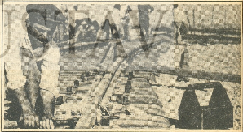
Ray döşeyen demiryolu işçileri.

Ulusal Kurtuluş Savaşı zaferinden ve Cumhuriyet'in ilanından sonra, milyonlarca Türk köylüsünün içinde bulunduğu ilkel ve zor koşulların düzeltilmesi yolunda hiçbir şey yapılmamış, vaad edilen toprak reformu gerçekleşmemiştir. Toprakların hatta köylerin büyük bir kısmı yine toprak ağalarının elindeydi. Tarım alanında egemen olan yarı feodal sistem değiştirilmeden olduğu gibi bırakılmıştı. Öşür kaldırılmış ama, geniş emekçi köylü kitlesi bu kez de tefecilerin sömürü ağına düşmüştü. Tarım alanında köklü hiçbir değişiklik yapılmadı.