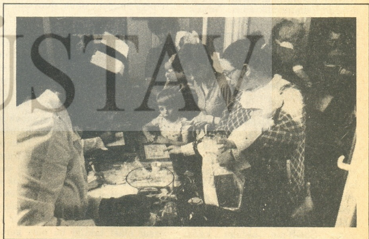
Varşova'da koruyucu ilaç dağıtıldı.

Görüldüğü gibi bu türden kazalar sadece Sovyetler Birliği'nde değil, diğer nükleer güç sahibi olan ülkelerde de meydana gelebilmekte, ve nükleer güce sahip olsun olmasın diğer ülkeleri de etkilemektedir. Şimdi denilebilir ki yüksek bir teknoloji ihtiva eden nükleer santrallerin nimetlerinden, verimliliğinden yararlanılmasın mı? Teknolojinin gelişmesinin önüne mi geçilsin? Hayır! Hiçbir gelişmenin engellenmesini istemek doğru bir tutum olmaz. Ama bilim ve teknoloji insanlığın hizmetinde olduğu ölçüde bir değeri vardır. Yoksa insanlığı tehdit eden bir teknolojik yararlanımdan -ne kadar "yüksek" değer taşırsa taşırsın- yana olmak mümkün değildir.