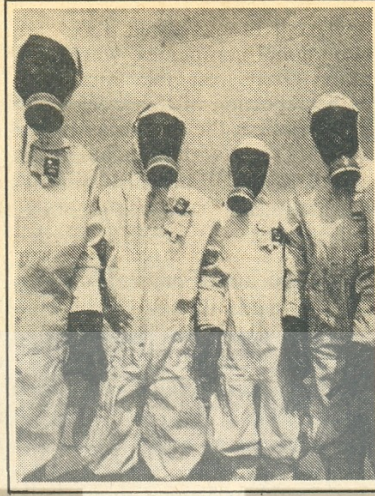
Radyasyon ölçen ekipler tüm Avrupa'da hızla çoğaldı.

Askeri ve iktisadi alanda rakibinden üstün olma mücadelesinin, insanlığın yararına kullanılacak nükleer enerjiyi ve maddi değerleri sonuçta insanlığı yok edecek silahlara dönüştürdüğü gözleniyor. Artık dünya üzerinde insanlığı bir değil, birkaç kez yok edebilecek nükleer silahlar var. Ve çıkabilecek nükleer savaş SSCB'nin olduğu kadar ABD'nin de sonudur. Ama bu gerçeklik dahi ABD ve Sovyetler Birli-