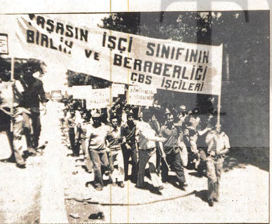
PDK GREVINI ZIYARETE GELEN CBS ISCILERI

arkadaşlar: "bu toplantıyı sözleşme yapılmadan yapmalıydık" diyerek "söz ve karar sahibi tabantoplu sözleşmeyi beğenmediklerini faşist I. Bölge başkan vekili "bu nun görüşmeleri aksatacağını" söy leyerek gizli pazarlık yaptıkla-