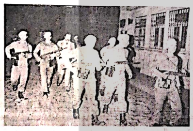
Mavi berelilerin yaptığı devrimcilerin çalışması na engellemek ve halka baskı uygulamaktır.

Halka karşı baskı, şiddet ve zorbalık aracı olan polis, mavi berelli jandama kuvvetleri ile takviye edildi. Hükümet şimdiki mavi berelileri daha çok ortadaki salarık yıpranmış ve teşhir olan polis teşkilatının yerini doldurmak için görevlendirildi. Ben kalarım önünde sıra sıra jandamalar burjuvazinin "kutsal" milliyetini korumak. Halkın sınıfların, ordunun görevi halkın güvenliğinin sağlanmasıdır, şeklindeki utanç verici yalanın hayatin ciddi örnekleri nasıl da güdüyor. Ordudaki polisin de en birinci, asli görevi büyük burjuvazi ve toprak ağaların milliyetini halka karşı korumak, sömürsüzlük teminat altına almak, bu milliyet sisteminde karşı çıkılan şiddet ve zorbalığa emektir. İkinci şiddet daha fazla ortadaki salınan mavi berelli polisle birlikte halka terör uyguluyorlar. Mavi bereliler evle