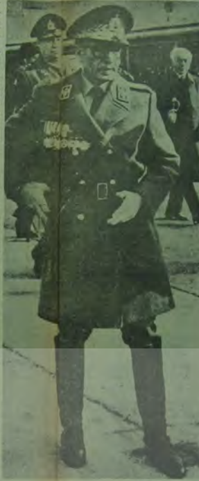
Üniformalar içinde elkanlı bir iktidar diktatörlüğünü bir gün daha sürdürmek için daha kaç genci, işçiyi, köylüyü öldürmesi gerektiğini düşünüyor.

İran'da muhalefet büyüdükçe büyüyor ve Şah küçülüyor.