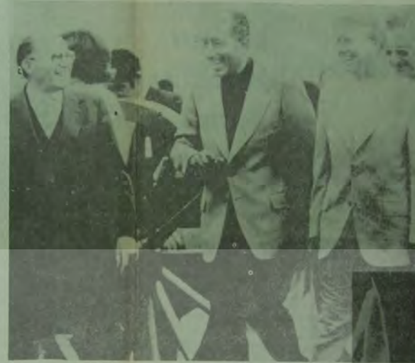
Begin Sedat ve Carter Filistin halkının ve Arap Halklarının mücadelesini durduramayacak

ABD, Mısır ve İsrail arasında Camp David'te varılan anlaşmaya tepkiler sürmektedir. Camp David anlaşması üzerine Suriye'nin başkenti Şam'da toplanan Suriye, Libya, Cezayir ve Yemen Demokratik Cumhuriyeti temsilcileri Mısır ile her türlü ilişkiyi kesmeye karar vermişlerdir. Zirve toplantısının kapanışı konuşmasını yapan Suriye Devlet Başkanı Hafız Esad, Camp David anlaşmasını imzalayan Enver Sedat'ı «eşi görülmemiş bir cinayet işlemekle» suçlamıştır. Direniş cephesinin toplantı sonucunda yayınladığı ortak bildiriye, cephe üyesi ülkeler Mısır'la ekonomik ve siyasi tüm ilişkileri kesmiş olduklarını ilan etmişlerdir.