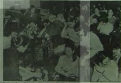
Yurtları boşaltılan kız öğrenciler Tabiiyet Odasında geçecekler

Göstermelik tedbirlerle okulları faşistlerden temizlemek ve öğrenim özgürlüğünü sağlamak mümkün olmayacaktır. Faşist odakların üzerine yürünün ve MHP ile birlikte tüm faşist örgütleri kapatın! Halkımız bunu istiyor.