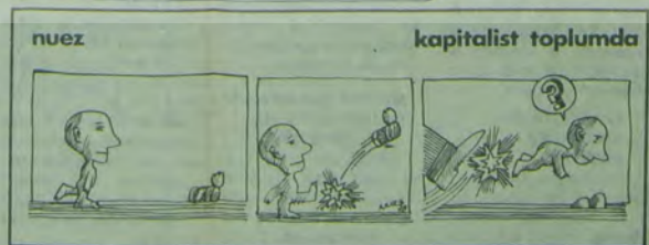
nuez kapitalist toplumda

Türkiye'de silahlı kuvvetlerin mevcudu, ambargo kalksın ya da kalkmasın, mutlaka azaltılmalıdır. Asker mevcudunun azaltılması sadece bir «İktisat» tedbirini olmakla kalmayacak, aynı zamanda uluslararası yumuşamaya da bir katkı olacaktır. Çünkü, emperyalizm halkları birbirine karşı kıskırtarak, silahlanmayı, asker mevcudunu çoğaltılmasını teşvik etmektedir. Bunun çeresini ülkelerin emekçileri çekmektedir.