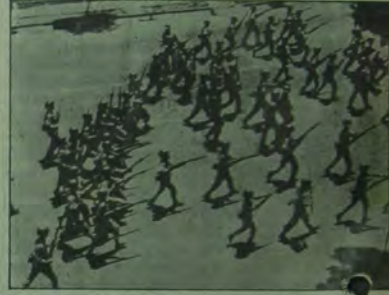
Halk muhalefetine ezmeye çalışan askeri birlikler

● Çarpışmalar sırasında 50'ye yakın kişi öldü.