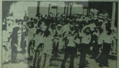
Diktatörlüğe karşı kitle hareketinden bir görünüş

İzlanda'da yeni kurulan Johansson başkanlığındaki hükümet komünistler bakan vererek katılmışlardır. Böylece Johansson hükümeti 80 kişilik İzlanda parlamentosunda 40 kişilik çoğunluk sağlamıştır. İktidarda komünistler de bulunduğu tek NATO ülkesi böylece İzlanda olmaktadır.