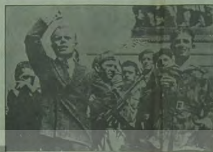
Sandro Pertini savaş sırasında bir konuşma yaparken.

Carter'in oturduğu koltuğun altında zulüm ve işkencenin tarihi vardır. Bu sermaye kuklası, bugün kalkmış insan haklarından söz ediyor, hem de insanları boğazlamak, insan kılığında hayvancıl yöneticilere arka çıkarmak. O, ağzını açmadan önce, İran'daki ölüm tezgahlarının, İspanya'daki ama çıkıklarının ve altın başlı yavruların, ölümlerinin Afrika'daki paralı askerlerin cinayetlerinin, Uzak asyada harcadığı her mermimin hesabını vermek zorundadır. İnsan haklarından, insanlık düşmanlarının söz etmeye hakkı yoktur.