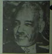
DEVRIK BAŞKAN MUHTAR DADDAH

Afrika'nın kuzeybatısında bulunan Moritanya'da 10 Temmuz günü, 18 kişilik bir subaylar grubu yönetimi bir darbeyle ele geçirdi. Yeni askeri yönetim siyasal kimliği henüz belli değil ama ilk gelen haberler, Moritanya'da emperyalizm işbirlikçisi politikasının sürecini ve Polisario kurtuluş hareketine karşı düşmanca ve saldırgan tutumun sürecini gösteriyor.