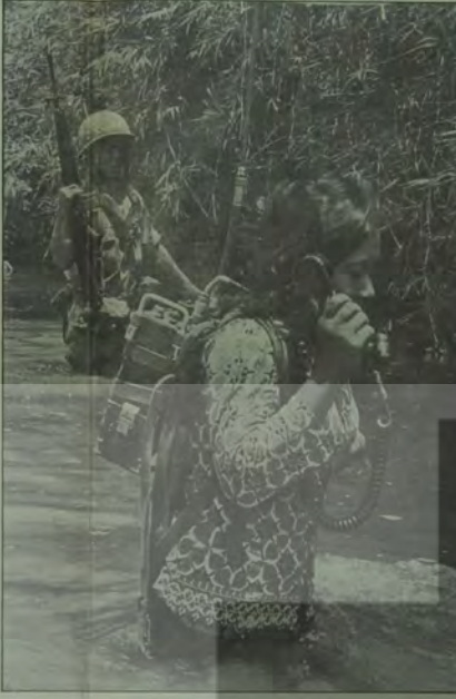
VIETNAMLILAR YURTLARINI BÖYLE SAVUNURLAR