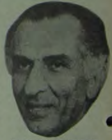
İran Cumhurbaşkanı Amuzgar

Şah celladının bu baş suç ortağı ve İran halklarının gözünde dönmüş düşmanı kendi ağzıyla kendini ele veriyor. Demokrasiye gitmekten söz edip, ülkede şimdilik demokrasi olmadığını iliraf ediyor. Yıllardır İranlı ilerici, yurtseverleri katlettiler, İran emekçilerinin alın terini emperyalizme peşkeş çektiler ve