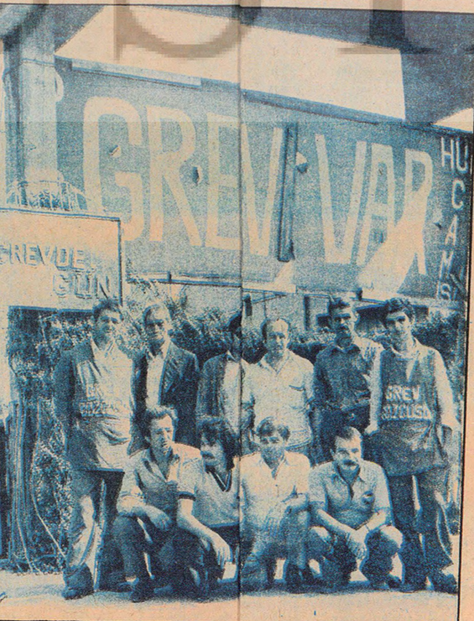
Topkapı Şişe Cam'da grev günkü gibi coşkulu.

Artık tek bir cam üretiliyor Türkiye'de. Artık cam işçisi grevde. Cama hayat veren güçlü eller bugün grev bayrağı taşıyor. Ateşin, buğün zavıflattığı yürek coşkulu. Bugün grev türküleri uyuluyor cam fabrikalarından. Bugün onur kavgasıdır cam fabrikalarından yükselen. İnsan gibi yaşamak için verilen kavgadır bu. Azgın sömürsüne karşı verilen kavgadır. Cam işçisi mutlaka kazanacaktır!