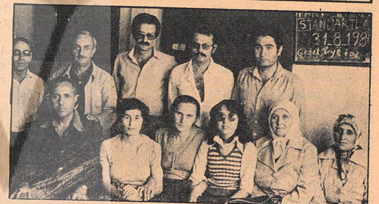
Cam işçilerinin TSİP Fatih İlçe Örgütüne ziyareti...