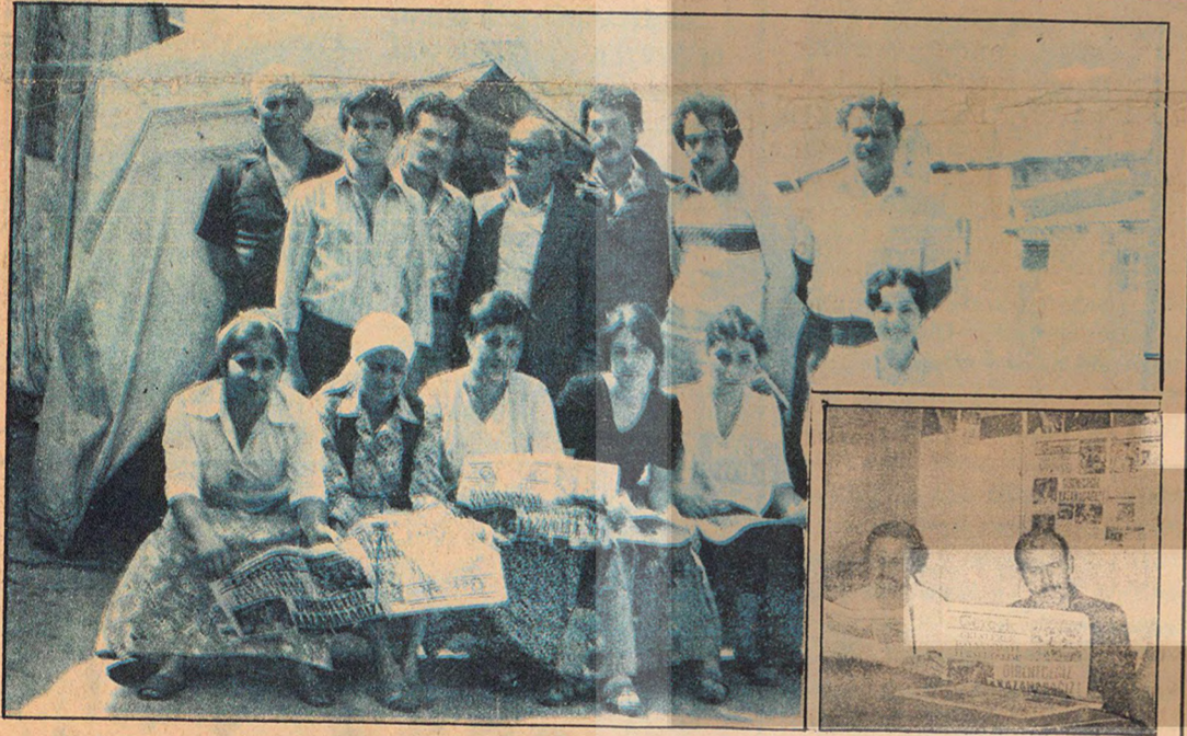
TSİP'in Grevlerle Dayanışma Kampanyasını grevci işçiler coşkuyla karşılıyor.