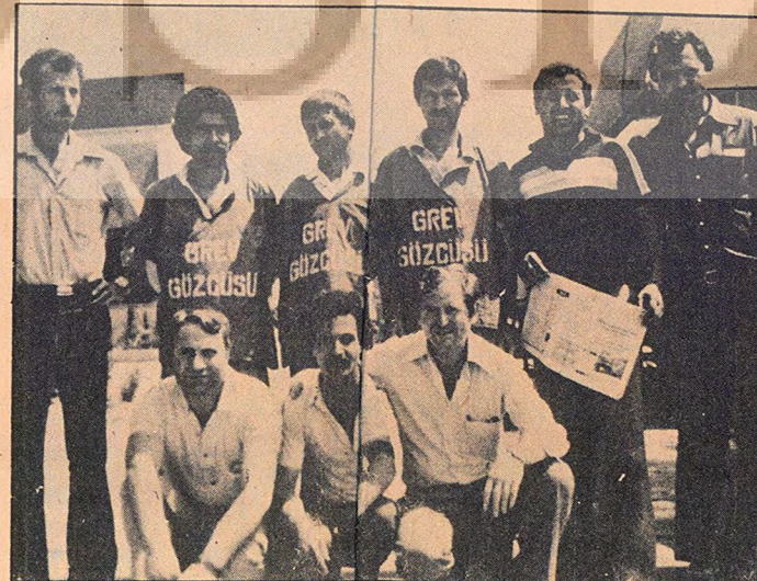
Bursa Otocam İşçileri, «Haklarımızı alana kadar grevimiz sürecektir!» diyor.