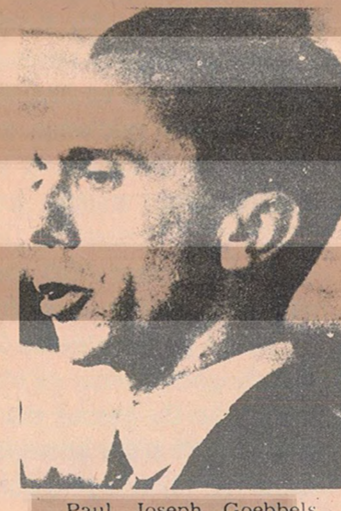
Paul Joseph Goebbels. Yenilgiden sonra karısı ile kızını zehirledi, kendini vurdu.

dini kapıdan dışarı atıp Berlin sokaklarında kaybolmak, umduu taşıyan 600 faşist yönetici ve uşak, birbirlerini çığnıyen tavuklar gibiydiler. Bir kaç kaçmayı başarırken, pek çoğu ülkenin dört bir yanındaki suç ortakları gibi, anti-faşist ordunun eline düştüler.