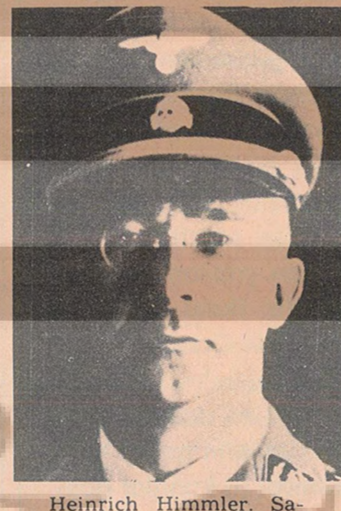
Heinrich Himmler. Savaş sonunda kendini öldürdü.