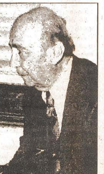
KOÇ'UN DEMEYİLE İLGİLİ YORUMUMUZ ARKA SAYFADA.

İşçi ücretlerinin ve fiyatların düşürülmesi için çare olarak gören Vehbi Koç'a karşılık, kapitalistlerin, karaborsacılığa ve stokçuluğa borçlu olan bazı patronların fiyatlarını düşürmelerini istiyor.