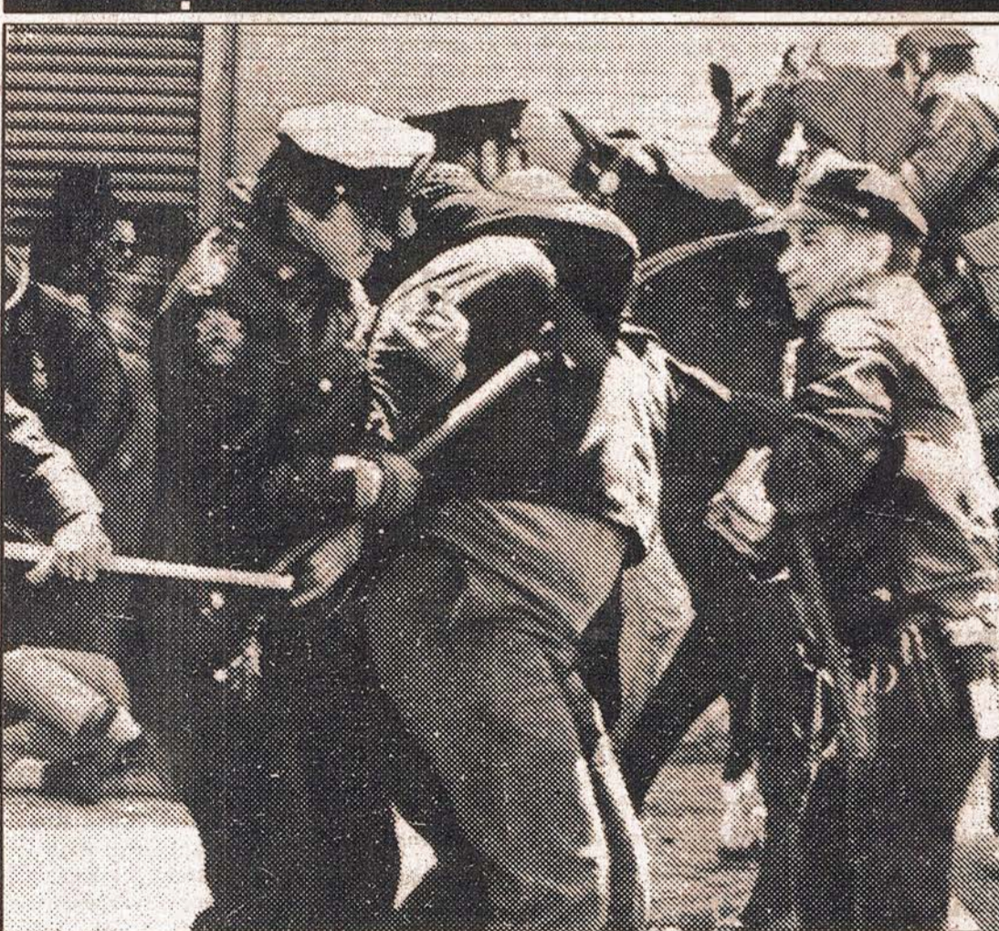
New York'ta işsizliği protesto eden işçilere polis saldırısı