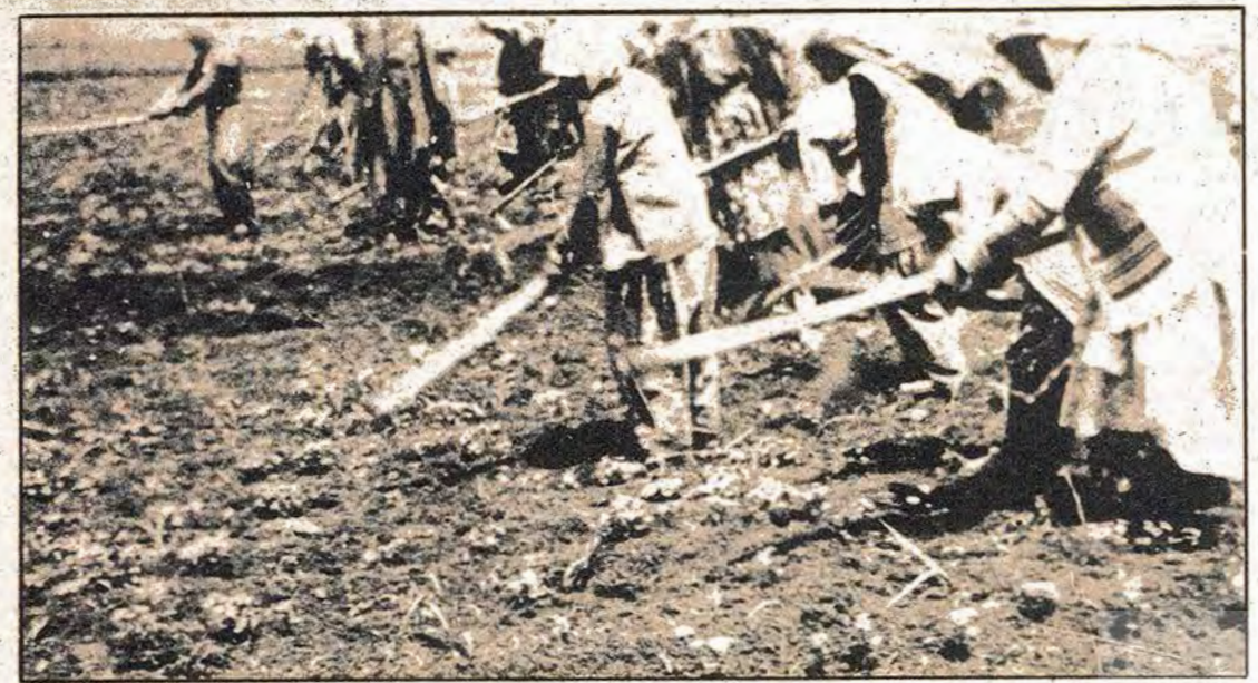
Kırsal kesimde çalışan kadımlar, son derece ağır baskılar altında... Sabahatan akşamına son buçu baka sallayan onlar...