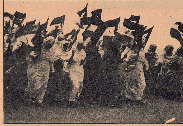
Polisario Cephesi'nin Batı Sahra'nın bağımsızlığı için verdiği mücadele zafere yaklaşıyor.

Aynı bildiride, Polisario birliklerinin birkaç gün önce Asmara kentini Fas askerlerinden geri aldıkları da anım satıldı.