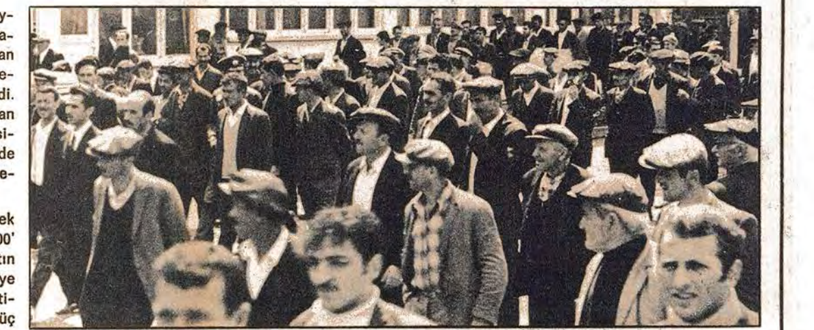
Son üç yıl ebluk yılın olarak nitelendirildi ama yüksel köylünün yüzü yine gülmeli. Üreten onlar, ezilen yine onlar.

Üretim maliyetinin çok yüksek olması ve arsanın enflasyon, yükselen köylüye sokuladirtiriyor. Türkiye'de üretimin çok yüksek olması ve arsanın enflasyon, yükselen köylüye sokuladirtiriyor. 197 yılında başlayarak büyük bir hızla artan döviz kurlarına yetmiş beş milyar dolarlık artış görülmüştür. Kültür, ilaç, kıyafet