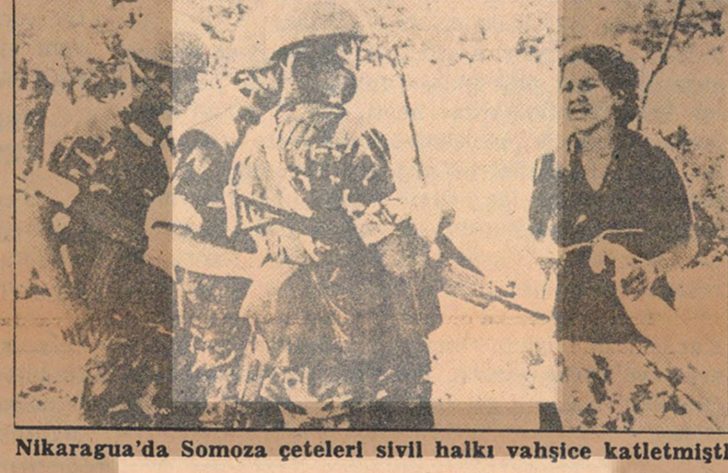
Nikaragua'da Somoza çeteleri sivil halkı vahşice katletmiştir.

Meksiko (a.a.) — B.M. Meksika Bürosu'nun bildirdiğine göre 1978 Eylül ile 1979 Temmuz'u arasında Nikaragua devrimi 35.000 kişinin ölümüne, 40.000 çocuğun da yetim kalmasına neden olmuştur.