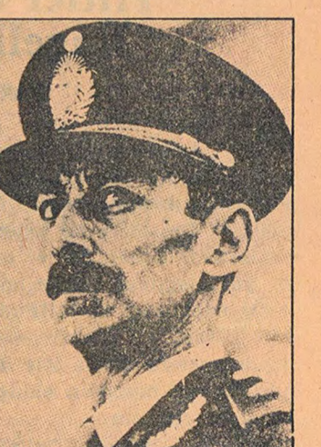
Cuntanın başı Videla. Yükselen toplumsal muhalefet karşısında cunta çatırdayor.

Son yıllarda AKP'ye kaydedilen üyelerin toplumsal bileşimi incelendiğinde görülür ki, üyelerin yüzde 70'ini ücretliler ve bunların da yarısını işçiler oluşturmaktadır. Büyük şirketlerde ve sendikalarda parti örgütlerinin güçlendirilmesine özel bir önem verilmektedir. Partiyeye yeni üye kazandırılması için harcanan çabalar sonunda büyük başarı sağlanmıştır. Yeni üyelerin yaklaşık yüzde 80'i eskiden peroncu olan genç işçilerdir. Parti, özellikle büyük sanayi merkezlerinde durumunu aile bilgilerine güçlendirmiş bulunmaktadır. Bu da AKP'nin tüm ülkede büyük etkinliğe sahip olduğunu kanıtlanmaktadır. Bilinç düzeyi yüksek işçiler biliyorlar ki AKP, Arjantin işçi sınıfının ve halkının en örgütlü ve en bilinçli müfrezesidir ve aynı zamanda, dün-