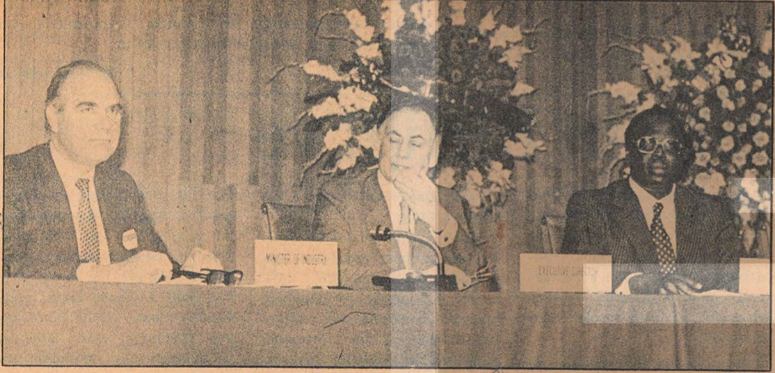
27 ülkenin sanayi bakanları ve diğer delegelerin katılımı ile yapılan gelişmekte olan ülkeler sanayi bakanları, yuvarlak masa toplantısı sona erdi.

1979'lardaki durum üç aşağı beş yukarı buna benziyor. Teoride yapılan ufak tefek değişiklikler meselâ stagflasyon, mevcut durumu açıklayabiliyor. Ama çözüm getiremiyor! Bu olgunun çözümü kapitalist sistemin içerisinde mümkün değildir. Eğer olsaydı şimdiye kadar sistem kendi kendine aksama-yı düzletebilirdi. Tıpkı kendi sonunu kendi eliyle hazırlayan, fakat bir türlü kendini yok etmeyen toplumsal sistemler gibi kapitalizm de kendi mezar kazıycısını, yani işçi sınıfını yaratmıştır ve onun kendisini yok etmesini beklemektedir.