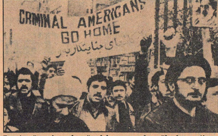
Devrim öncesi sıcak mücadele esnasında, yükselen anti-emperyalist talepler, halk güçlerinin birliğini sağlayan temel etkeni. Oysa şimdi, ABD İran'ın silah satışı tekrar başlatıyor!

Geçtiğimiz günlerde İran Dışişleri Bakanı Yazdi, bir açıklama yaparak, ABD'nin yedek parça vermemesi halinde aralarındaki anlaşmaları bozarak başka ülkelere silah alacaklarını bildirmişti. Elinde kullanılmamış çeşitli malzeme bulunan ABD'nin, bu açıklama üzerine tavırını değiştirerek yedek parça vermeye başlaması, çeşitli çevrelerce ABD'nin en yoğun silah ticareti yaptığı ülkeyi kaybetmek istemediği şeklinde yorumlanmaktadır. Gazete ayrıca, Şah rejimi sırasında ismarlanan 4 spruan destroyer'ini teslimi sırasında ortaya çıkan sorun parasal güçlüğü de Amerikan Sena-